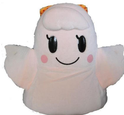
シンボルキャラクター「愛ちゃん」